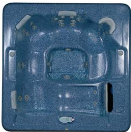
Spa Antigua 32

Appareils d'hydrothérapie destinés à un usage privé.