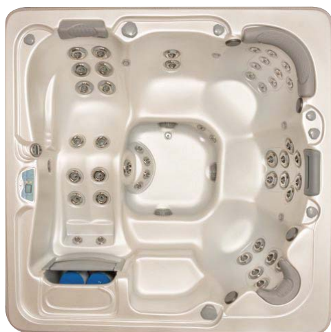
Spa Antigua 52