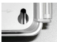
Fixation murale en queue d'aronde