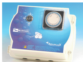
Elexium balai - Réf : ELXB