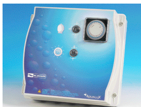
Elexium Filtration + projecteur(s) Réf : ELXF1/2P